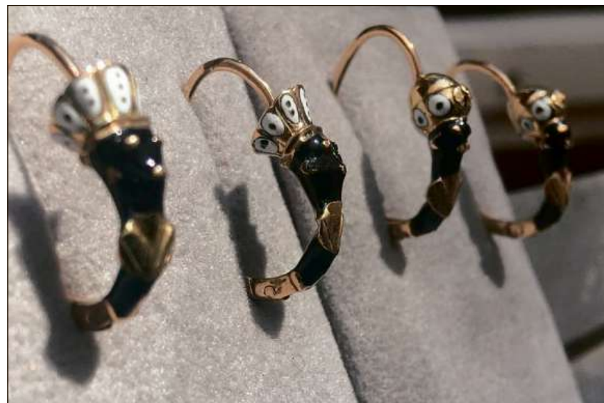
Retgs cun curuna da pennas e sclavs cun turban. Quai èn las duas variaziuns classicas dals morins engiadinais.

Quest artitgel da la redactura RTR Isabelle Jaeger – dal rest ina purtadra da morins – datti en ina versiun extendida cun films e contribuziuns audio sin www.rtr.ch